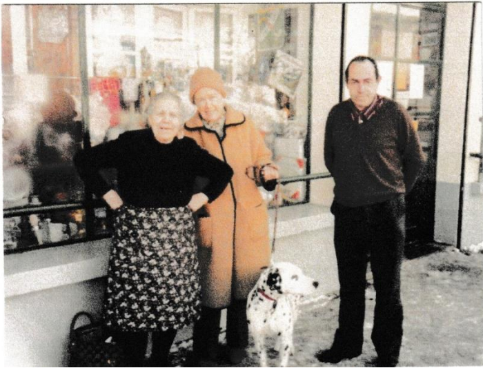
Nous remercions Robin MURRU pour les photos et souvenirs qu'il a bien voulu partager avec nous.