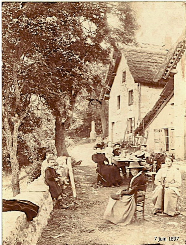
Les gantières des Meunières ST PANCRASSE 1898