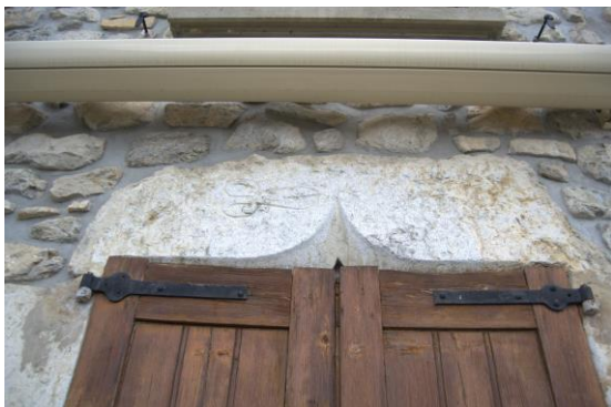
Ciseaux de gantière gravés sur une maison de St Pancrasse.

https://www.ici.fr/infos/culture-loisirs/quand-grenoble-gantait-la-reine-1662746947